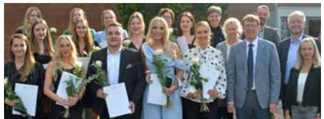
↑ BACHELOR of Science in Pflege