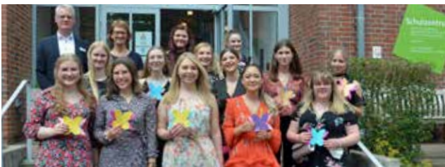
↑ Staatlich anerkannte Fachschule für DIÄTASSISTENZ

Unsere Absolventinnen und Absolventen, die 2022 ihr Examen bestanden haben