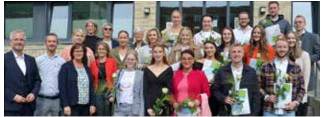
↑ Staatlich anerkannte Fachschule für PHYSIOTHERAPIE