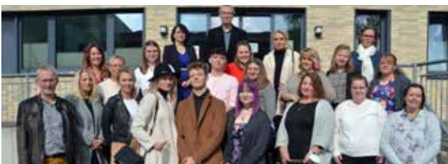
↑ Fachschule für PODOLOGIE